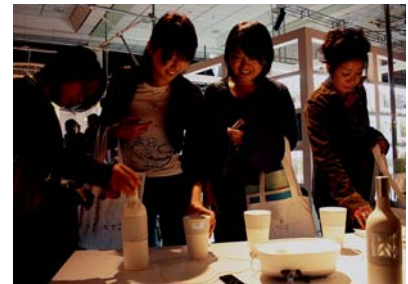
2007年ワークショップ成果 「Supper」 Audio for PC & Potable Audio デザイン=倉本仁